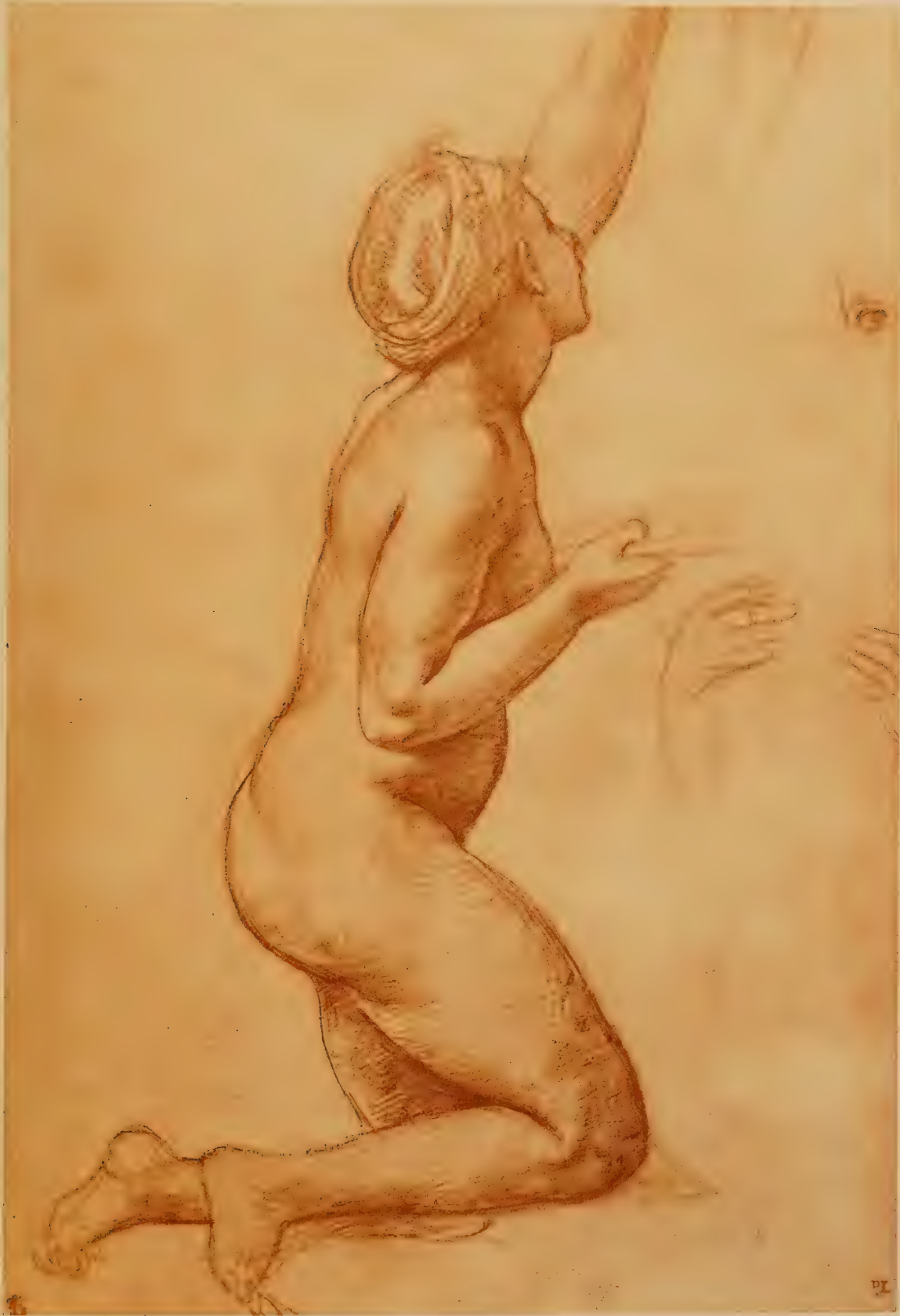
Dessin d'une jeune fille et esquisses